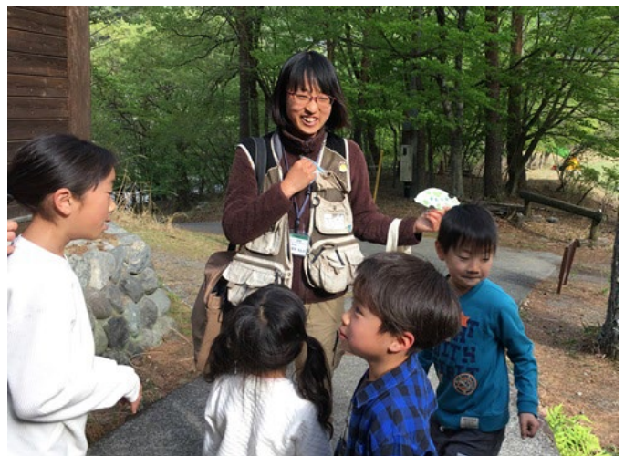
子供たちのプログラム