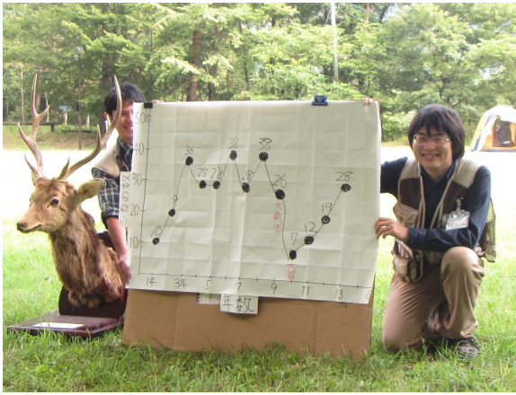
プログラムのサポート