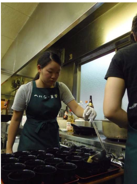
ヘルシー美里にて配膳サポート