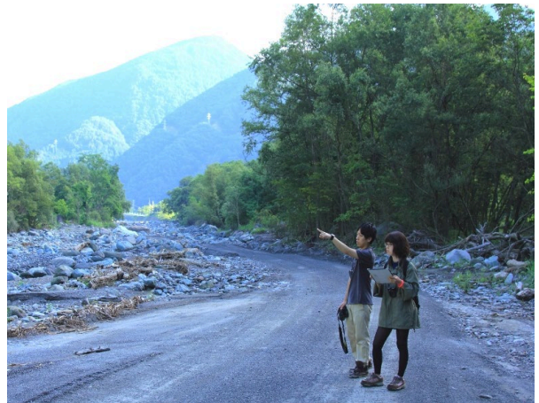
野鳥センサス調査に同行