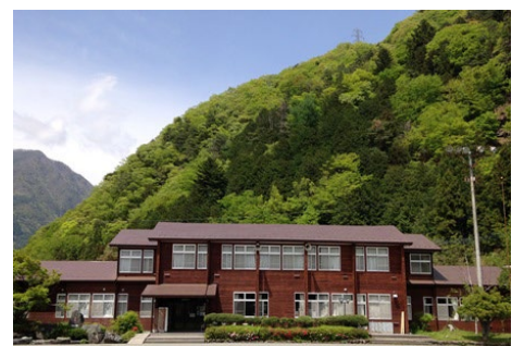
校舎の宿 ヘルシー美里